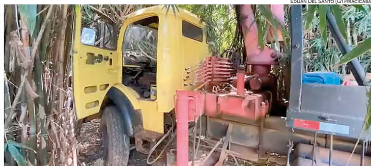
EDIJAN DEL SANTO (G1 PIRACICABA)

As três vítimas do sequestro foram localizadas. Por volta das 2h30, a PM recebeu um chamado informando que três pessoas